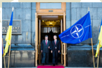
PRÄSIDIJALAMT DER UKRAINE

Laut der NATO ist eine souveräne, unabhängige und stabile Ukraine ausschlaggebend für die Sicherheit im euro-atlantischen Raum. Die Ukraine kooperiert zwar schon seit Anfang der Neunzigerjahre mit der NATO, heute ist diese Partnerschaft jedoch wichtiger denn je. Im Juni 2017 hat die ukrainische