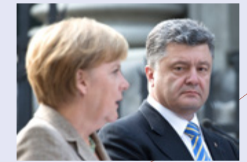
PRÄSIDIJALAMT DER UKRAINE

„Ich habe sehr deutlich gemacht, dass ein Projekt North Stream 2, ohne dass wir eine Klarheit haben, wie es mit der ukrainischen Transitrolle weitergeht, nicht möglich ist“